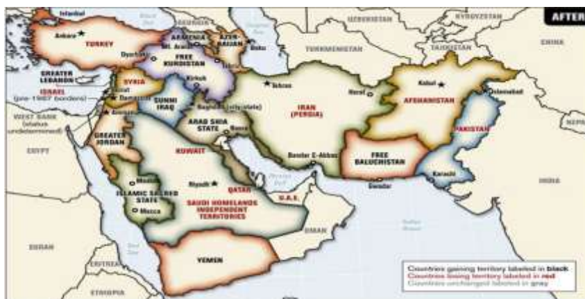
نقشه شماره ۱: مرزبندی های آینده خاورمیانه