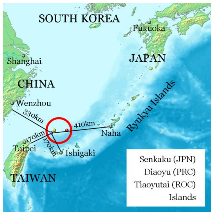
نقشه ۱: موقعیت جزایر

چندی است که اختلافات ارضی چین و ژاپن در حال تشدید شدن و رسیدن به مرحله تهدید نظامی است. جزایری غیرمسکونی در دریای جنوبی چین که هم اکنون تحت مالکیت ژاپن است و چین نیز مدعی است که این جزایر متعلق به این کشور است، مهم‌ترین نمونه این اختلافات است. دور جدید این اختلافات و تنش سیاسی همزمان با سالگرد اشغال بنادر چین توسط ژاپن در سال ۱۹۳۱ و گفته‌های یک سیاستمدار دست راستی ژاپنی برای انضمام آنها به ژاپن در سال ۲۰۱۳ آغاز شد (پوررشیدی، سایت تبیان، ۱۳۹۱). پس از پایان جنگ سرد، دریای جنوبی چین یکی از نقاط مهم قلمداد می‌شود که در جزایر آن منابع طبیعی مثل نفت، هیدروکربن، منگنز و ماهی وجود دارد و از نظر